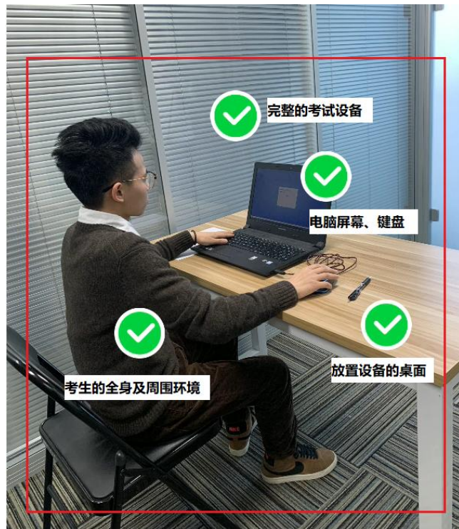
图四：佐证视频监控视角

(5) 电脑端和移动端摄像头全程开启拍摄考试过程。移动端拍摄的视频通过“智考通”上传，请耐心等待全部视频上传完成，如提示上传失败，请选择重新上传，请考生务必确认佐证视频全部上传成功。如出现视频拍摄角度不符合要求、无故中断视频录制等情况，都将影响成绩的有效性，由考生本人承担所有责任。